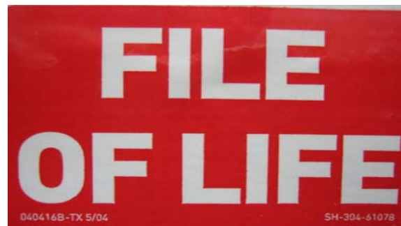
Imagen de la calcomanía File of Life

Además, el File of Life viene con 2 calcomanías en color rojo y blanco que podrá colocar en la ventana principal de la entrada de su casa o en el parabrisas de su auto para alertar al Personal de Emergencia de la existencia del File of Life en el refrigerador, la cartera o auto.